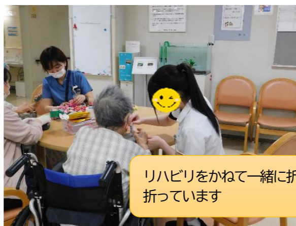
リハビリをかねて一緒に折り紙を 折っています