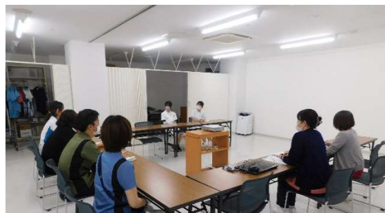
学生さんから色々な質問をいただきました 体験を通してこの仕事に興味をもってもらえたかな!?