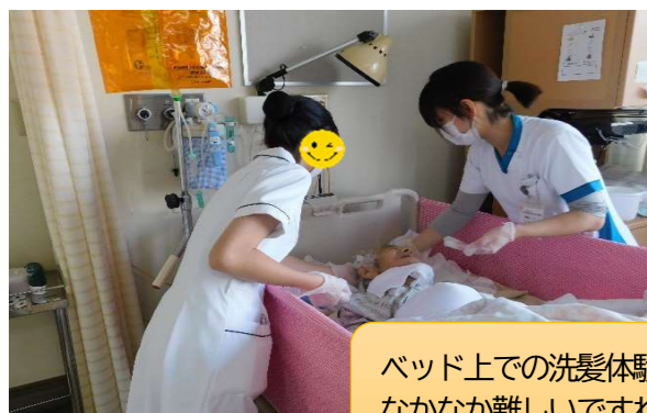
ベッド上での洗髪体験 なかなか難しいですねー

2023年12月1日(金)に職場体験学習で中学生2名が来てくれました。 体験学習のねらいは実際に仕事を体験し、働く人々とのふれあいを通して労働の喜びや大変さを知り、社会に通用する職業人となるための疑似体験と自身の進路選択や将来について考えるきっかけづくり、ということだそうです。 なんだか責任重大です・・・。 早速白衣に着替えて、看護師の世界へGO!! いろいろな体験をしてもらいました。